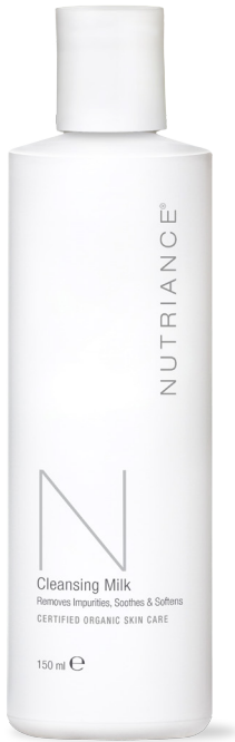
Cod. 361 | 150 ml

Pasul 1: Curatare & Detoxifiere – Curatarea tenului si gatului este primul pas al rutinei zilnice pentru mentinerea pielii sanatoase si tinere. Produsele pentru curatenia fetei din gama Nutriance Organic sunt imbunatatite cu ingrediente de origine marina si vegetala pentru indepartarea delicata a impuritatilor pielii.